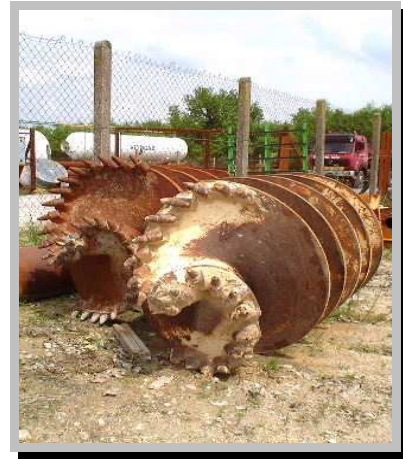
Outil de foration : tarière